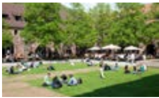
Zeughaus-Mensa im Marstall