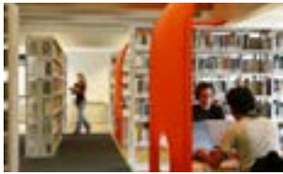
Bibliothek Campus Bergheim