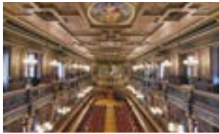
Aula der Alten Universität, Campus Altstadt