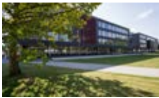
Neubau des Physikalischen Instituts, Campus Im Neuenheimer Feld

Der Campus Neuenheimer Feld wurde in den 1960-er Jahren begründet und beherbergt heute die