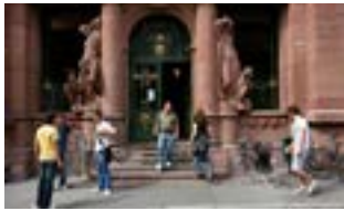
Universitätsbibliothek, Campus Altstadt

Über das Motivationsstipendium für Absolvent*innen Deutscher Auslands- und Partnerschulen informiert das Dezernat Internationale Beziehungen der Universität Heidelberg.