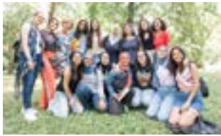
Schülergruppe der Deutschen Schule der Borromäerinnen Alexandria zu Besuch in Heidelberg, Probestudienwoche Juni 2019

Über den Fächerkatalog im Internet können Sie sich zudem individuell angepasste Informationen zu den jeweiligen Bewerbungsverfahren und den jeweils einzureichenden Unterlagen anzeigen lassen. Wählen Sie hierfür das gewünschte Studienfach durch Klicken auf die gewünschte Abschlussvariante und Klicken auf „Studienfach merken“ (roter Button) aus und ergänzen Sie im nächsten Schritt die Angaben zu Ihrem Bewerbungsprofil.