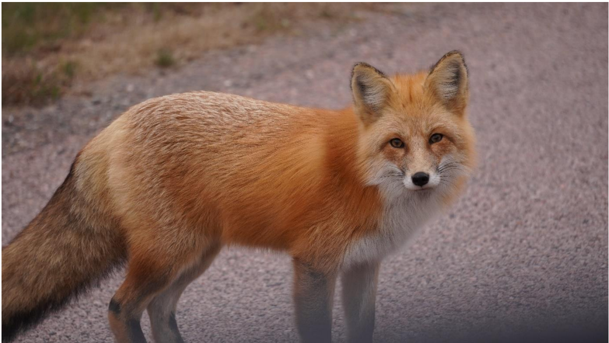
Hiking around Thunder Bay (Sleeping Giant Provincial Park)