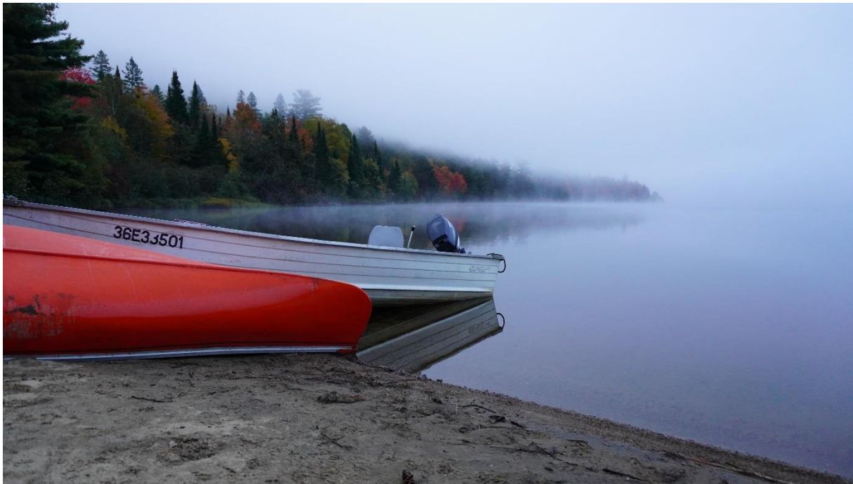
Algonquin Park Camping, Oktober 2023