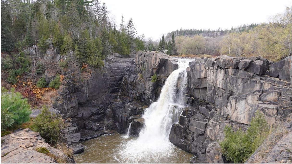
Hiking around Thunder Bay