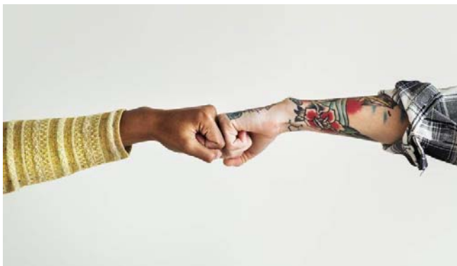
Das Buddy-Programm für internationale Studierende