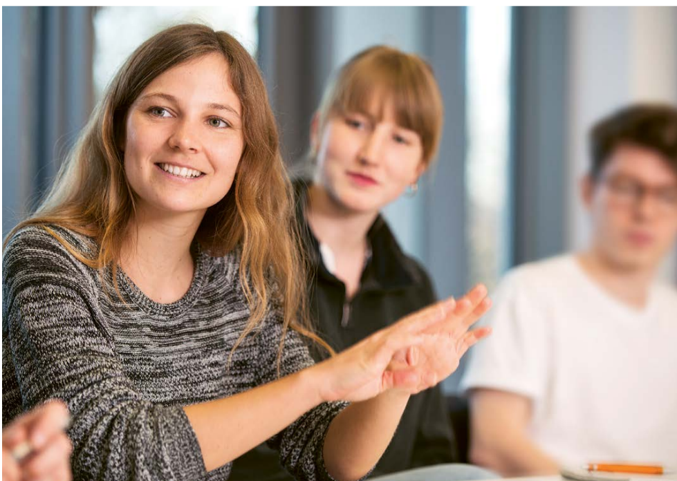
Die Marsilius-Studien stehen allen Interessierten offen.

Vom breiten Fächerspektrum der Ruperto Carola profitieren: Interdisziplinäres Programm für Studierende