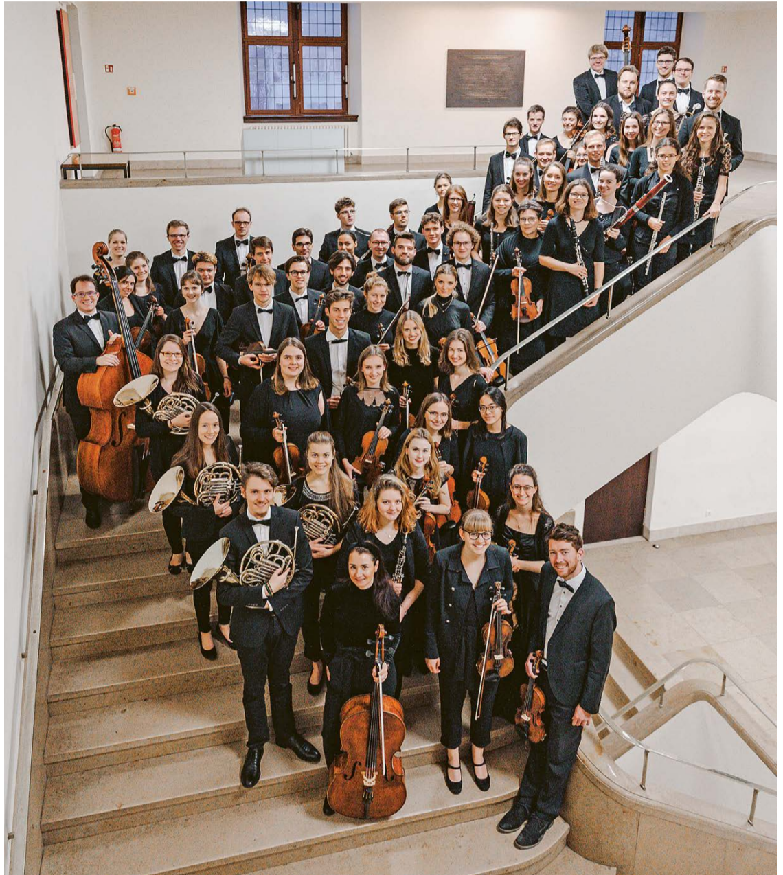
Feste Größe im kulturellen Leben der Ruperto Carola: Universitätsorchester.

»Wir wollen jetzt so normal wie möglich ins neue Semester starten, mit regelmäßigen Präsenzproben. Corona hat uns aber gelehrt, flexibel zu sein. Wir sind auf alles gefasst. Geplant ist ein Weihnachtskonzert mit dem Weihnachtsoratorium von Camille Saint-Saëns in der Heidelberger Peterskirche im Rahmen der Reihe »Takte gegen Krebs« des Nationalen Zentrums für Tumorerkrankungen. Im Februar soll dann unser traditionelles Konzert zu Semesterabschluss ebenfalls live vor Publikum stattfinden. Auf dem Programm stehen die »Akademische Festouvertüre« von Johannes Brahms sowie Antonín Dvořáks Symphonie Nr. 9 »Aus der neuen Welt«. Der Universitätschor, der sonst mit 100 Sängerinnen und Sängern gemeinsam mit unserem