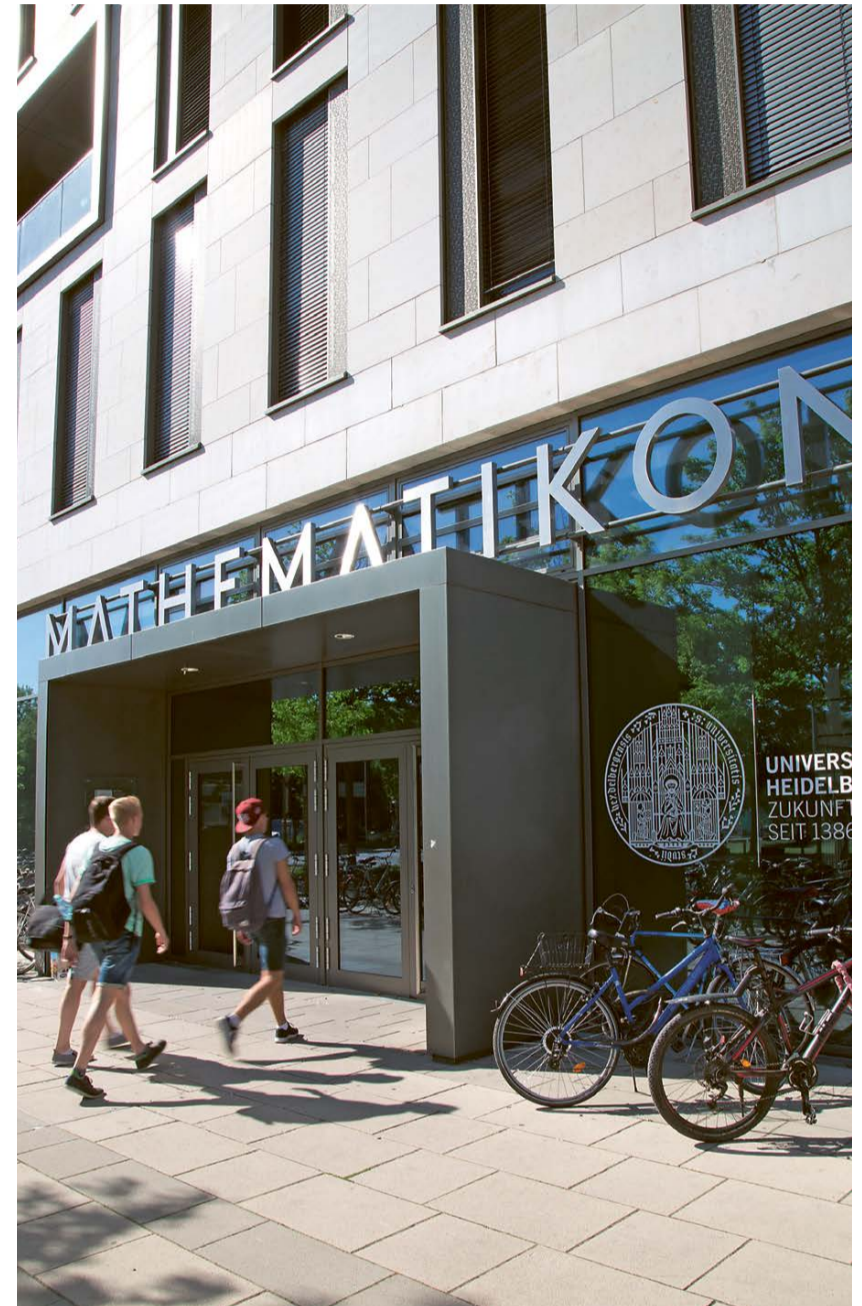
Ihren Sitz hat die neue Fakultät im »Mathematikon« auf dem Campus Im Neuenheimer Feld.