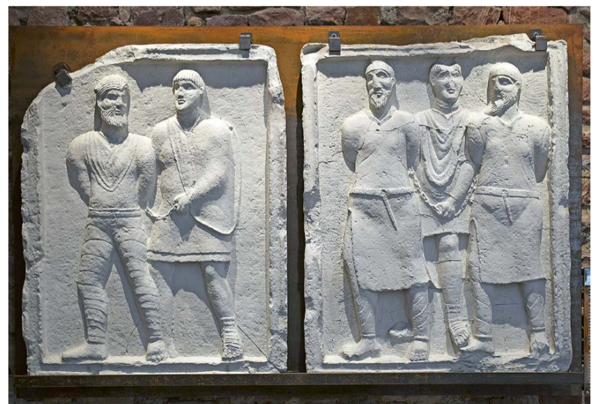
Von den ursprünglich 54 figürlichen Bildfeldern des Siegesmonuments »Tropaeum Traiani« haben sich 48 erhalten. Im Jahr 2020 wurden die Abgüsse im Zuge der Sanierung des Hörsaalgebäudes Heuscheuer neu inszeniert und montiert.