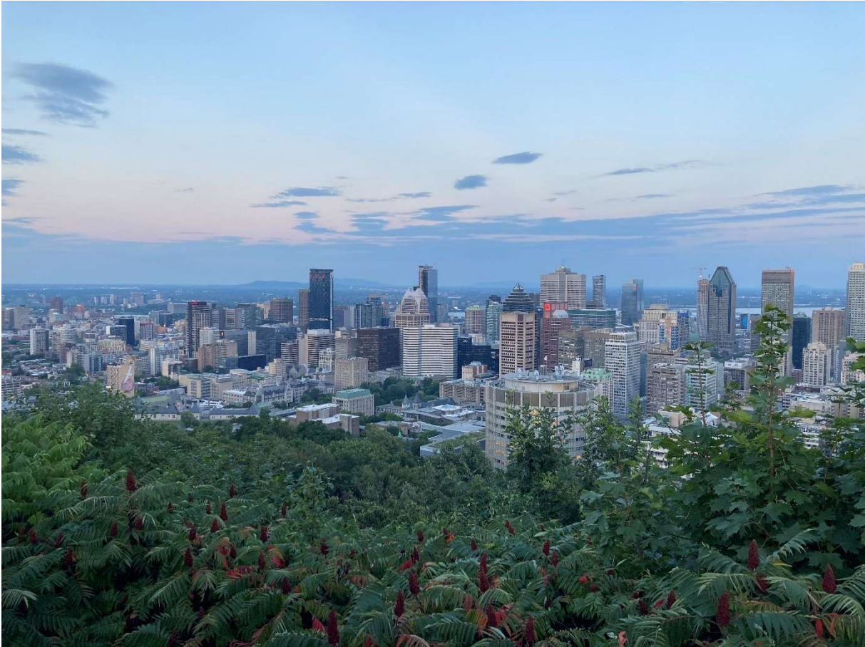
Blick auf Montréal vom Mont Royal.