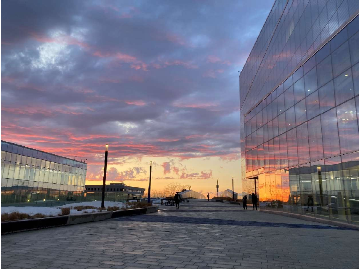
Der Campus MIL bei Sonnenuntergang.