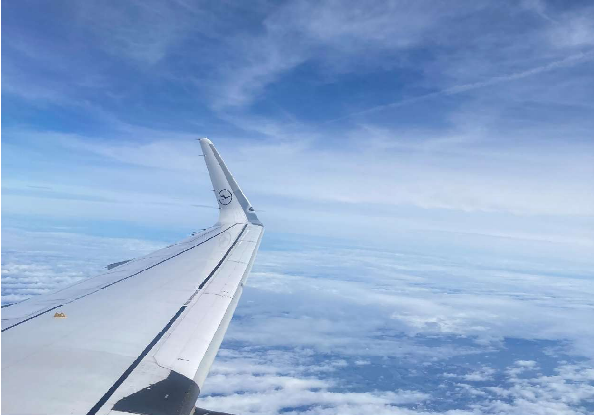
Blick aus dem Flugzeug.