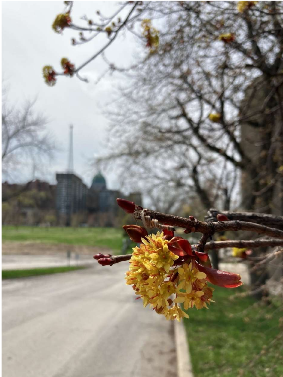
Frühlingsimpressionen aus der Cimetière Notre-Dame-des-Neiges.