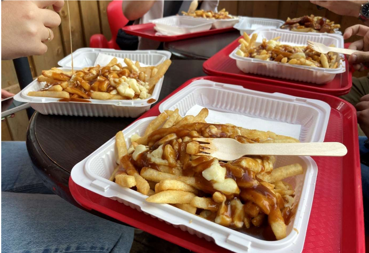
Poutine, eine Quebecer Spezialität.