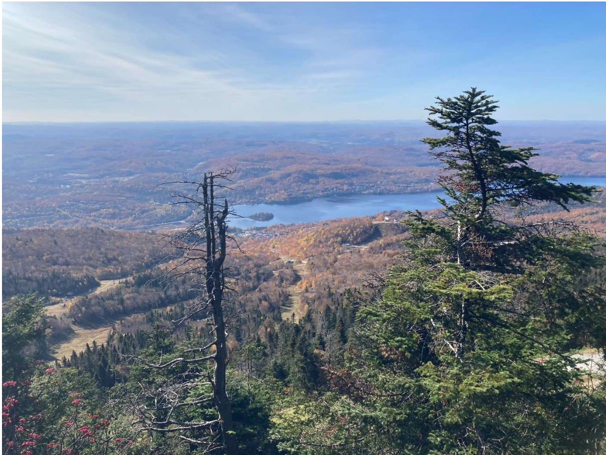
Blick vom Mont Tremblant.