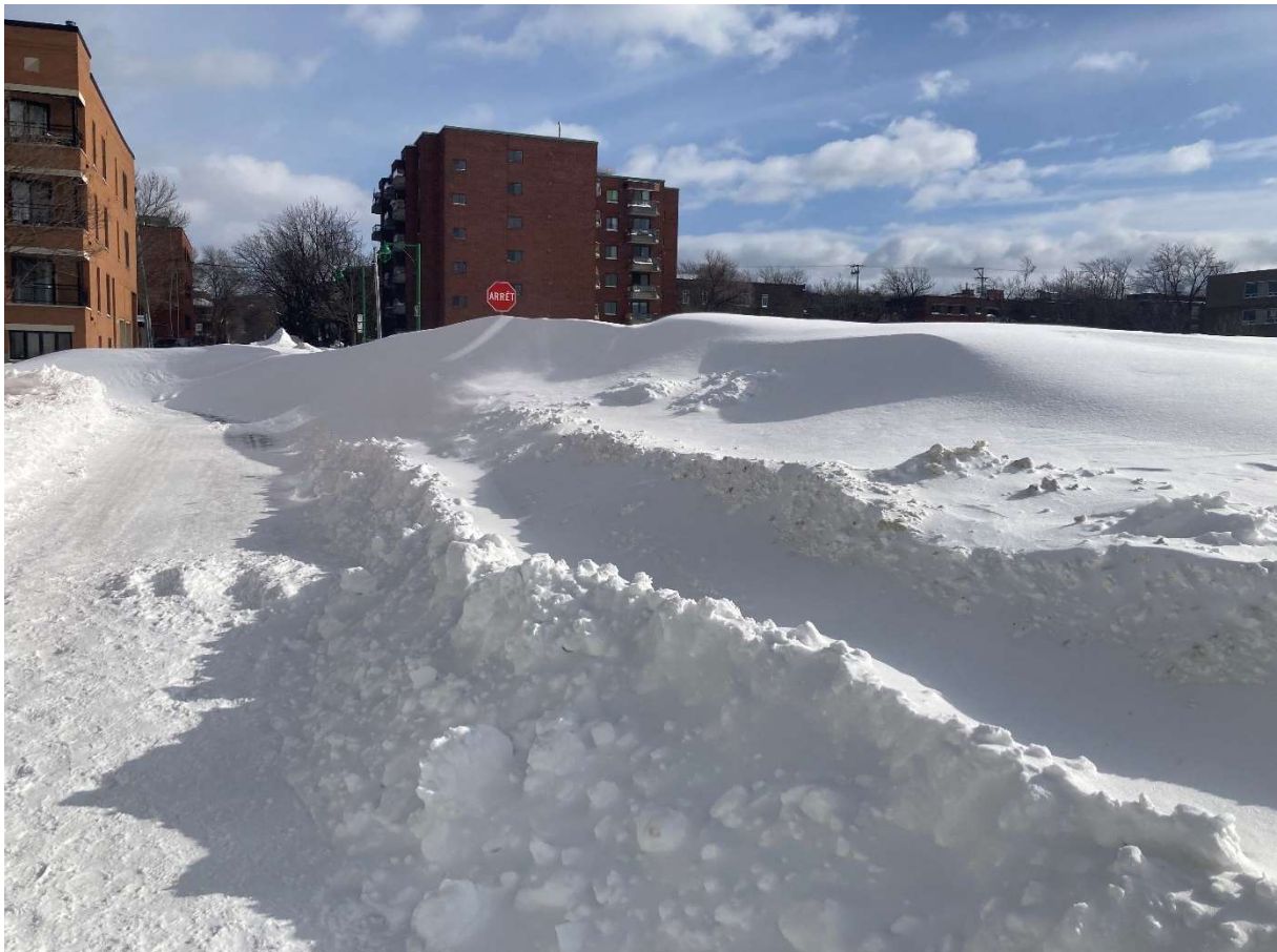
Eine Straße nach starkem Schneefall.