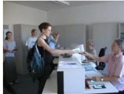
Examinations office of the Faculty of Physics and Astronomy